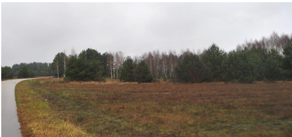
Rys. 3. Obszar objęty opracowaniem – część centralna