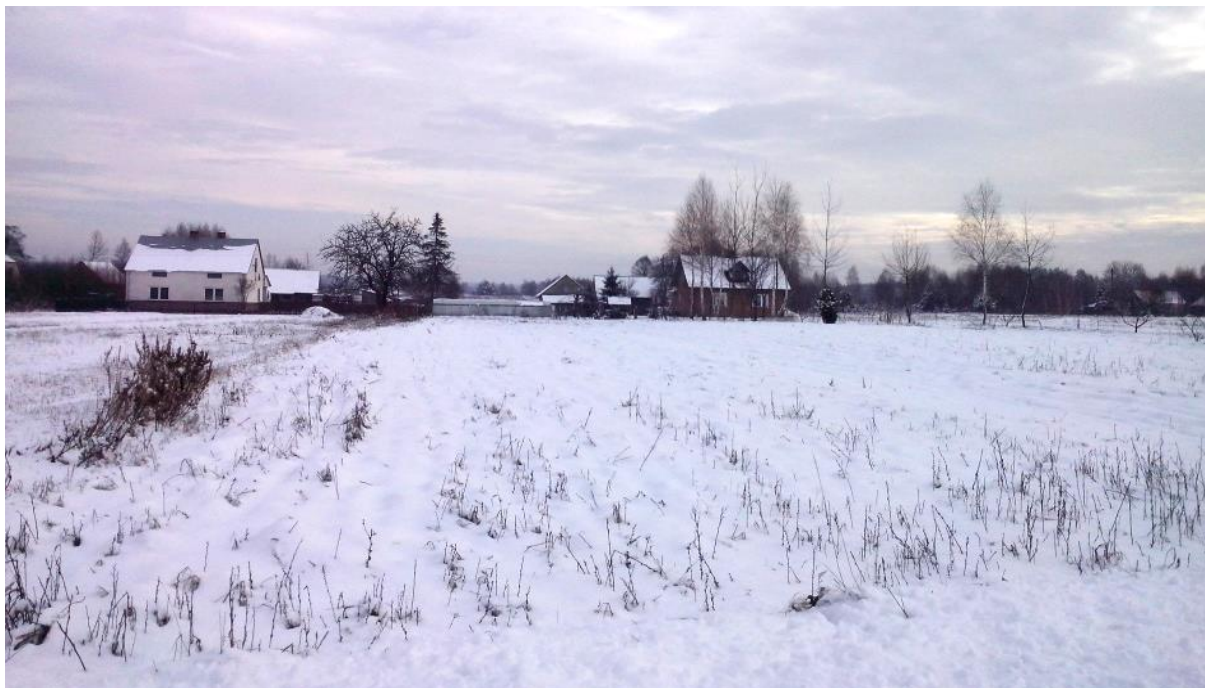
Rys. 5. Obszar objęty opracowaniem – widok na istniejącą zabudowę w północnej części

W projekcie miejscowego planu zagospodarowania przestrzennego wprowadzono następujące wydzielenia: