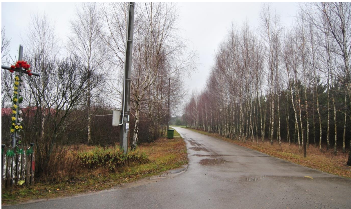
Rys. 2. Obszar objęty opracowaniem – południowy fragment