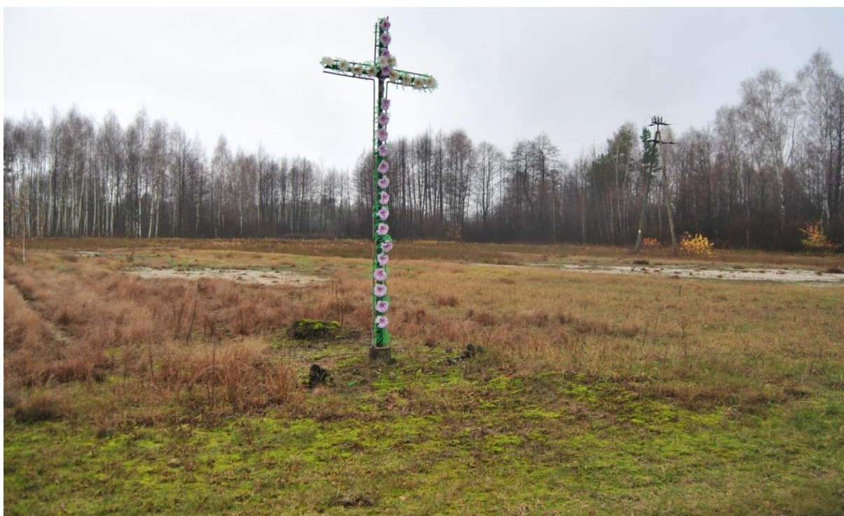
Rys. 4. Obszar objęty opracowaniem – północny fragment