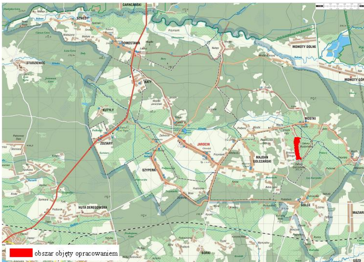
Rys. 1. Lokalizacja obszaru objętego miejscowym planem zagospodarowania przestrzennego na tle gminy Jarocin