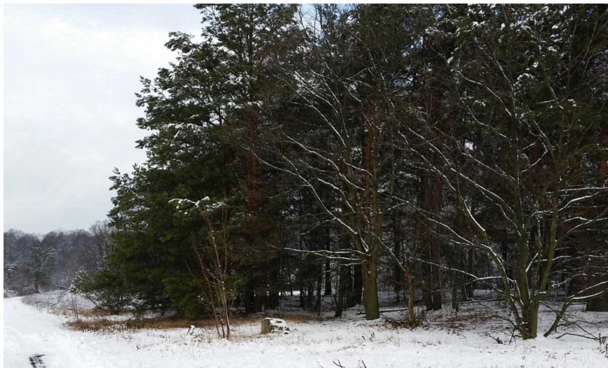
Rys. 2. Obszar objęty opracowaniem – widok z drogi gminnej Mostki Podpory – Graba w kierunku zachodnim