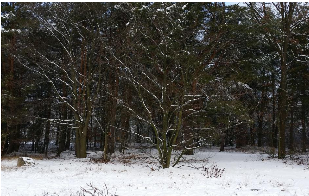
Rys. 4. Obszar objęty opracowaniem – część centralna