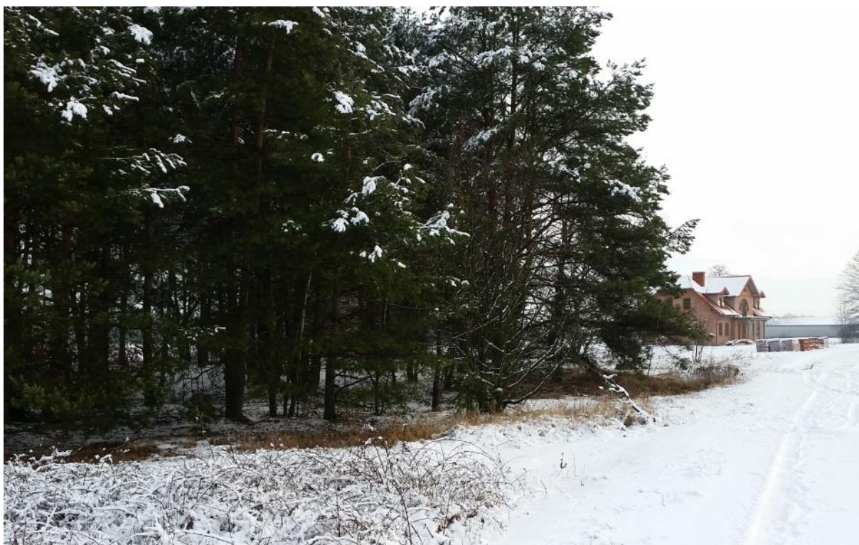
Rys. 3. Obszar objęty opracowaniem – widok z drogi gminnej Mostki Podpory – Graba w kierunku wschodnim