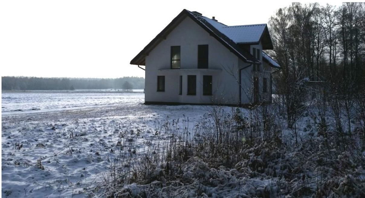
Rys. 4. Obszar objęty opracowaniem – widok na część Majdan Golczański (Knieja) z drogi powiatowej Zdziary–Huta Krzeszowska na stronę południową