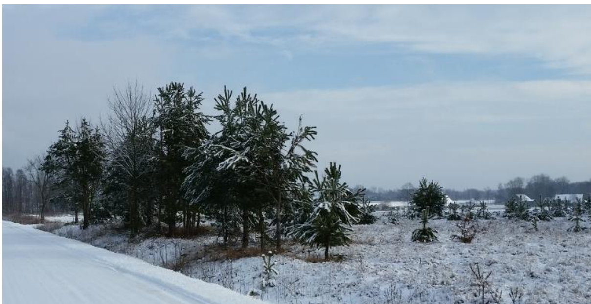
Rys. 5. Obszar objęty opracowaniem – widok na część Majdan Golczański (Biedaczów) z drogi powiatowej Jarocin–Ulanów w stronę wschodnią