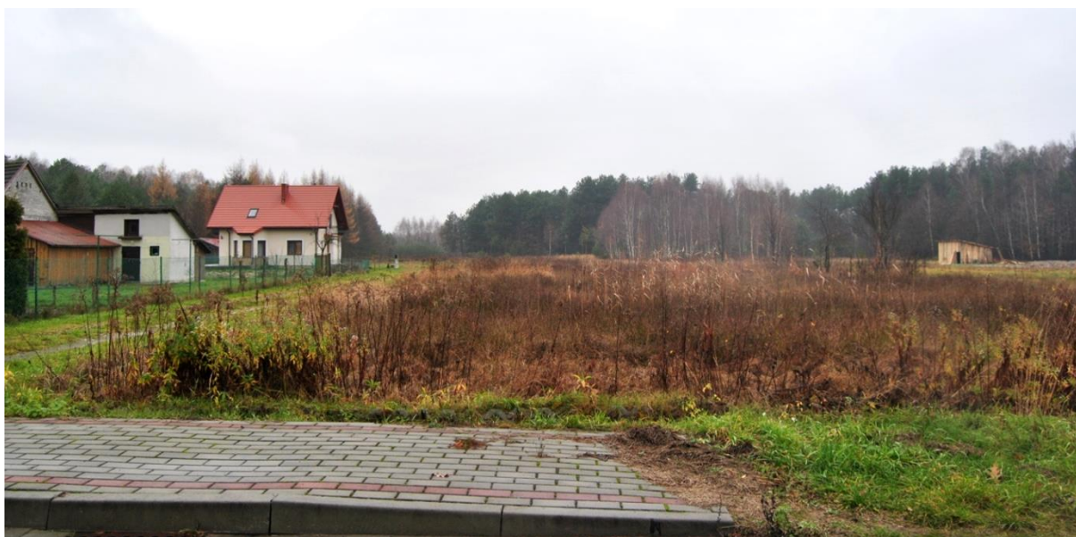
Rys. 3. Obszar objęty opracowaniem – widok na część Jarocin (Przymiarki) z drogi powiatowej Jarocin–Ulanów w stronę zachodnią