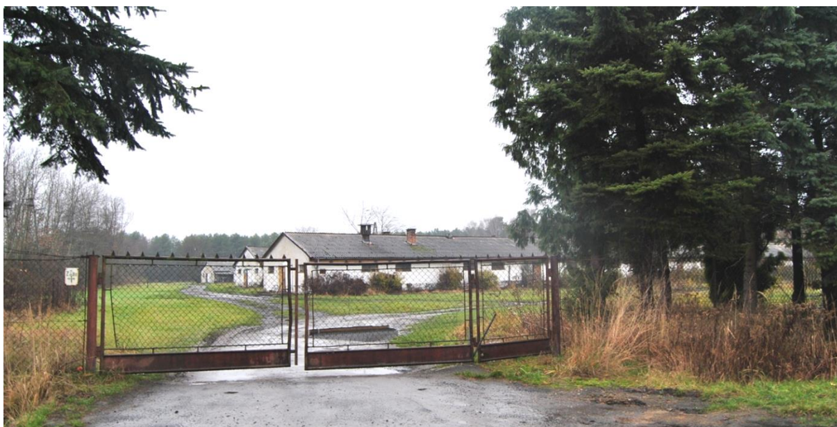
Rys. 2. Obszar objęty opracowaniem – widok na część Jarocin (Przymiarki) – tuczarnia w północnym fragmencie planu